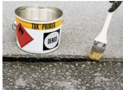
Bild 1 Stryk primer på kanten

Efter att varmasfalten lagts ut, vilket bör ske snarast efter att bandet applicerats skall vältningen påbörjas längs kanterna, så att bandet pressas samman till en "nitskalle", som ger ökad täthet.