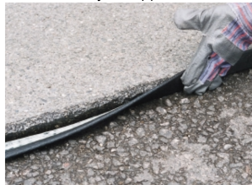
Bild 3 Tryck fast bandet mot kanten