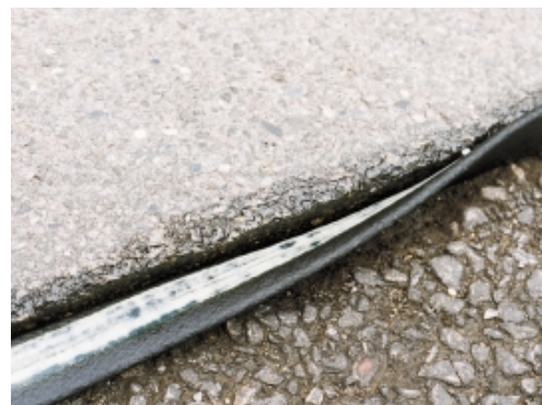
Bild 2 Lägg ut bandet med klisterytan uppåt