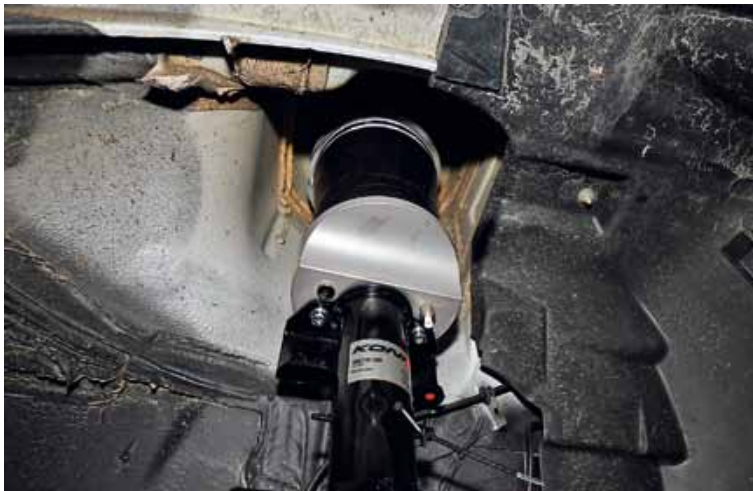
▲ Det nya fjäderbenet på plats. Luftbälgen är utformad som en hög munk med hål i mitten.