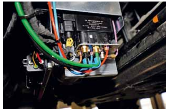
▲ När kompressorn monterats under bilen dras luftslangarna fram. Varje slang har en unik kulör så man vet vart den går. Hela paketet är färgkodat vilket underlättar för montören.