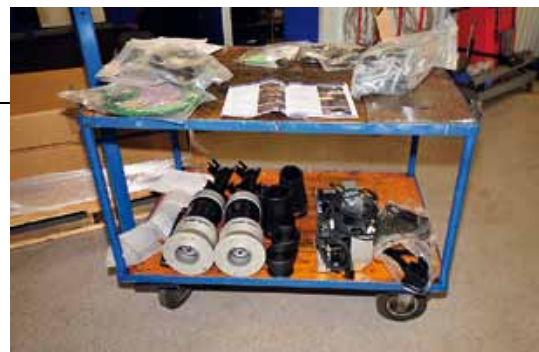
▲ Allt utlagt inför monteringen. Det är ganska tunga saker, bilen lägger på sig 50 kilo. På bilden saknas de nya halva bladfjädrarna och Panhardstaget.

Dessutom kan ägaren kasta sina nivåklossar. Han trycker på en knapp och ställer bilen i nivå. □