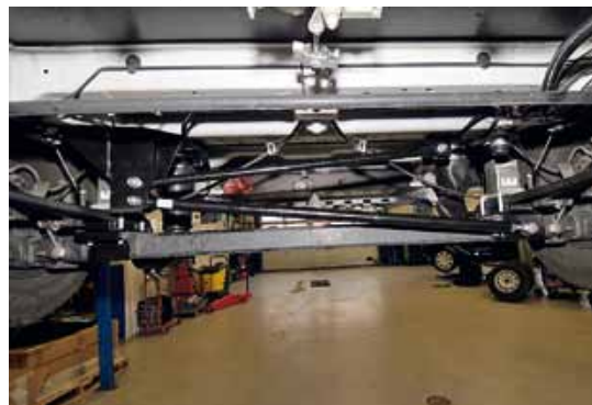
▲ För att stabilisera bakaxeln monteras ett Panhardstag, de två runda stavarna som syns ovan bakaxeln.