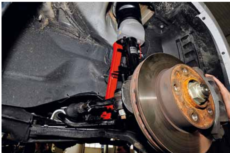
▲ Framvagnens höjd ställs in med hjälp av ett verktyg som fixerar på rätt höjd.

Kompressorn är hjärtat i systemet. Den fyller och tömmer bälgarna på kommando. ▼