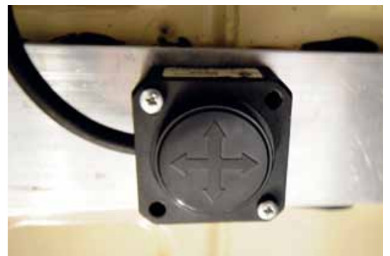
▲ Om kompressorn är hjärtat har vi här hjärnan – sensorn som ger signal om hur bilen står. Monteras under bilen så nära rörelsecentrum som möjligt.

Kompressorn är hjärtat i systemet. Den fyller och tömmer bälgarna på kommando. ▼