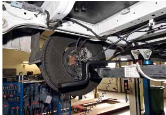
▲ Originalbladfjäders byts ut mot en utformad att montera en luftbälg på.